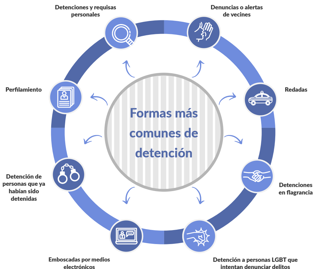
Ciertas formas de detención parecen ser comunes en diferentes regiones.

procedimiento casi formal como parte del protocolo de actuación policial.