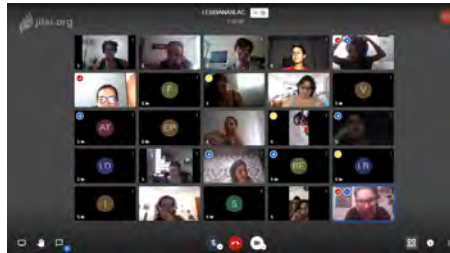
Capturas de pantalla de una reunión virtual del sábado 26 de Abril de 2020

Las cinco organizaciones que constituimos el Grupo Coordinador de LESLAC por ahora son, la Fundación Mujer & Mujer de Ecuador, la Red Boliviana de Lesbianas y mujeres bisexuales, la Corporación Femm de Colombia, A.C Musas de Metal de México, y Lesbianas Independientes Feministas Socialistas - LIFS de Perú. Nosotras nos reafirmamos como LESLAC - Red de Organizaciones de Lesbianas y mujeres bisexuales de Latinoamérica y el Caribe - y nos acompaña el propósito de crear espacios de reflexión, diálogo y trabajo para articular acciones que atiendan los efectos de la discriminación y las violencias en el ámbito público y privado contra las lesbianas, mujeres bisexuales, adolescentes, jóvenes, adultas y adultas mayores en América Latina y el Caribe; trabajamos para que LESLAC sea una red feminista, articulada y reconocida, con influencia y capacidad de gestión en las políticas públicas regionales, y que impulse y fortalezca el activismo lésbico en LAC.