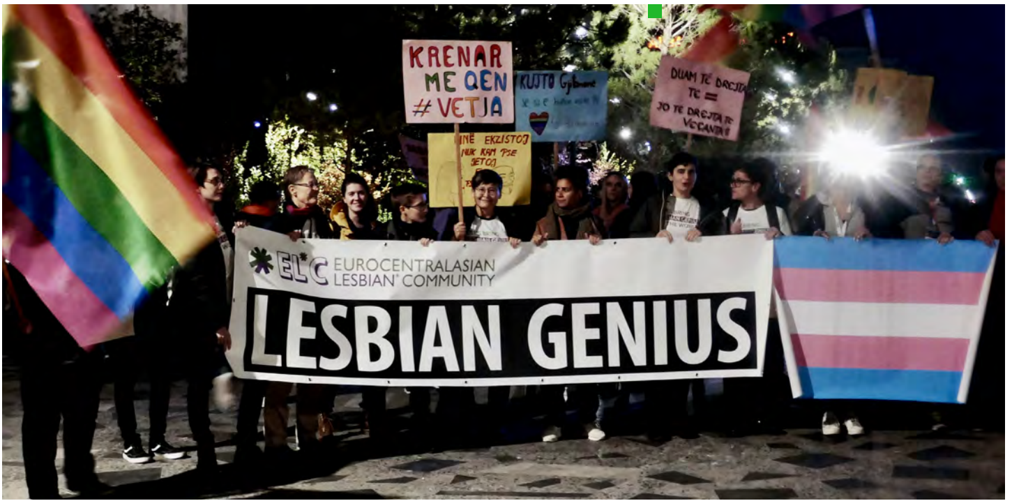
Foto: Leila Lohman, Primera Marcha Lésbica de Tirana (Albania) en 2019).

en Ámsterdam en 1980, y casi 40 años después, la EL*C reunió a más de 500 lesbianas de 50 países diferentes en Viena para su conferencia inaugural en 2017. Nuestra inspiración parte de todo lo que ellas impulsaron en su momento, desde sus productos creativos hasta las formas de organizarse entre países y regiones.