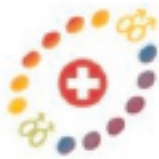
ILGA XXIII Conférence Mondiale Genève